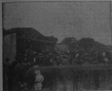
El público madrugador frente al hanger de Terce esperando los vuelos.

Tercé: he ahí el "dolo" del día. Todos los entusiasmos están pendientes de sus vuelos. Basta que alguien lance la noticia de que Terce volará "a tal o cual hora" para que millares de personas marchen inmediatamente a la Sabana. Creemos que esos "boleros" son "amigos incondicionales" de la Compañía del Tranvía, que, con esto de los vuelos de Terce es la que se ha puesto las "botas" con codiciados resultados económicos. Anter, día de San José, y por lo tanto día de fiesta oficial, alguien regó la bola que el aviador volaría por la tarde. Y desde las dos el llano de Mata Redonda fue visitado por cuatro o cinco millares de personas. La animación durante toda la tarde en la calle de la Sabana fue inmensa.